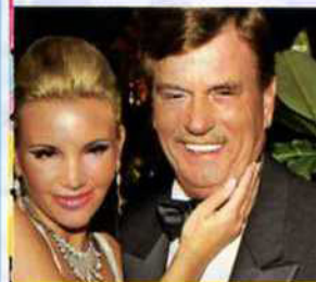
BLOOM & WINSLET Bei „zu freizügig für den Adel“, sagte er unlängst. Danke, Foffi!