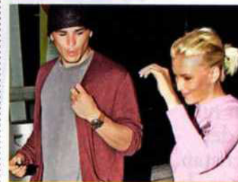
HARTNETT & JOHANSSON Beim Dreh zu „The Black Dahlia“ lernen sie sich kennen: Hält die Liebe?