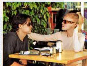
BLOOM & BOSWORTH Ob sich Orlando und Kate auch nach ihrer nächsten Trennung versöhnen?