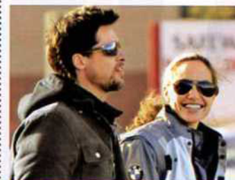
PITT & JOLIE Heiraten sie? Adoptieren sie noch ein paar Kinder? Tätowieren sie sich?

Wenn Hollywood-Stars ihr Liebesleben für sich behalten, meinen sie es meistens ernst. Und machen uns neugierig. Vor allem, wenn es sich um Paare handelt, die offensichtlich prima zusammenpassen. Wie's wohl weitergeht bei: