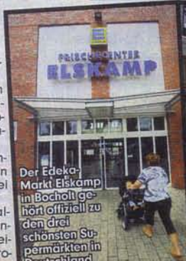
Der Edeka-Markt Elskamp in Bocholt gehört offiziell zu den drei schönsten Supermärkten in Deutschland