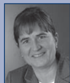
Silke Hossenfelder , Vorsitzende der 4. Beschlussabteilung, Bundeskartellamt