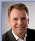
Manfred Wolff , Vorsitzender des Vorstandes, Bundesverband der Dienst- leister für Online-Anbieter e.V. (BDOA)