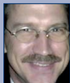
Andreas Polster , Referent, Bundesministerium des Inneren